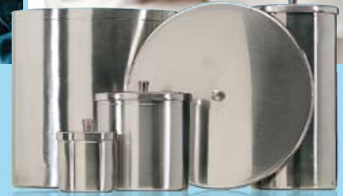
VADDBURK MED LOCK DRESSING JAR WITH LID