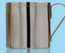
SPOTTKOPP UTAN LOCK SPUTUM MUG WITHOUT LID