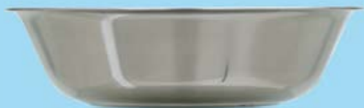
HANDFAT WASH BASIN

575002 Ø 320 x 85 mm 575003 Ø 360 x 80 mm