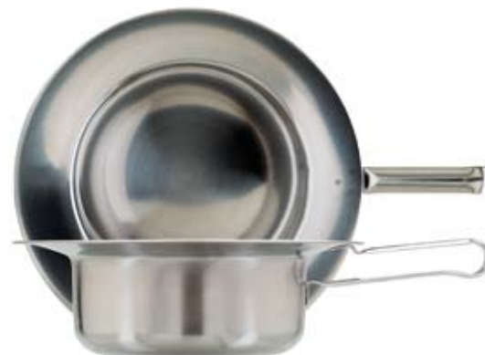
BÄCKEN MED BANDHANDTAG BEDPAN WITH BAND HANDLE