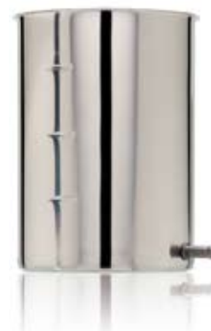
SKÖLJKANNA UTAN HANDTAG IRRIGATOR WITHOUT HANDLE

533001 Ø 100 x 165 mm 1 L 533002 Ø 120 x 175 mm 1,5 L 533003 Ø 130 x 195 mm 2 L