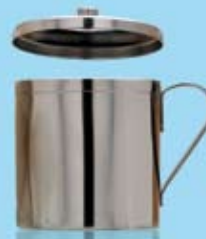
SPOTTKOPP MED LOCK SPUTUM MUG WITH LID