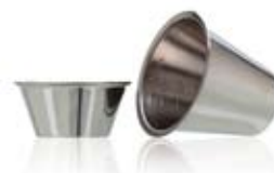
MEDICINBÄGARE MEDICINE CUP

542001 Ø 85 x 80 mm 0,2 L 542002 Ø 95 x 85 mm 0,3 L 542003 Ø 60 x 50 mm 0,075 L 542004 Ø 50 x 45 mm 0,04 L 542005 Ø 70 x 45 mm 0,12 L