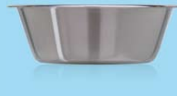
BÄCKENINSATS INSERT BOWL