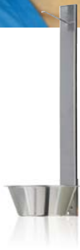
TOALETTBORSTSTÄLL MED DROPPSKÅL TOILET BRUSH STAND WITH SLOP BOWL