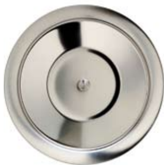
KNOPPLOCK KNOB LID

531001 Ø 235 x 70 mm 531002 Ø 310 x 80 mm