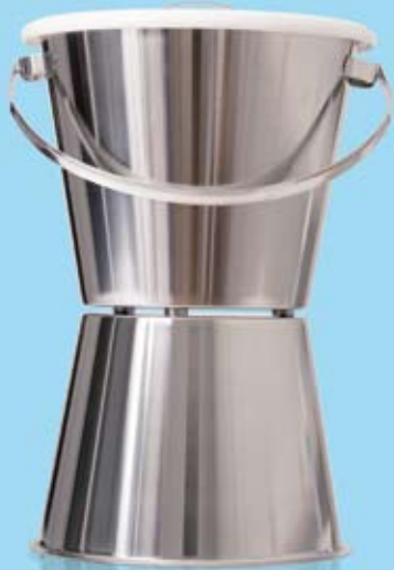
KLOSETTHINK MED UNDERDEL COMMODE PAN WITH STAND