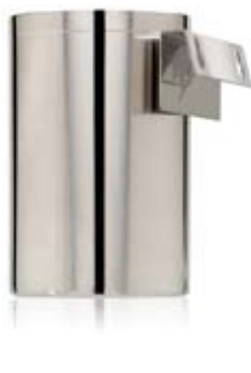
TOALETTBORSTSTÄLL HANG UP STAND FOR TOILET BRUSH