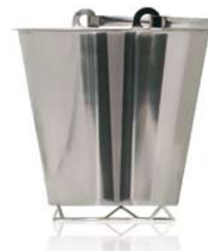
HINK MED TRÅDBOTTENBAND BUCKET WITH WIRE BOTTOM BAND

523204 Ø 235 mm 7 L 523202 Ø 300 mm 12 L 523200 Ø 285 mm 8 L 523203 Ø 320 mm 15 L 523201 Ø 295 mm 10 L