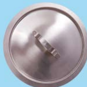
KLOSETTLOCK LID FOR COMMODE PAN