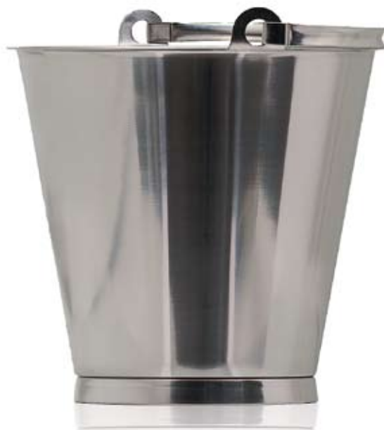
HINK MED BOTTENBAND BUCKET WITH BOTTOM BAND

523007 Ø 255 x 245 mm 7 L 523000 Ø 285 x 205 mm 8 L 523001 Ø 300 x 245 mm 10 L 523002 Ø 310 x 270 mm 12 L 523003 Ø 325 x 315 mm 15 L