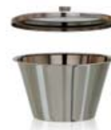
PROTESBURK MED KNOPLOCK DRESSING JAR WITH KNOB COVER