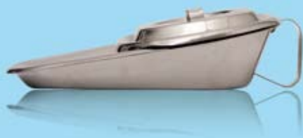
FRAKTURBÄCKEN SLIPPER PAN WITH HANDLE