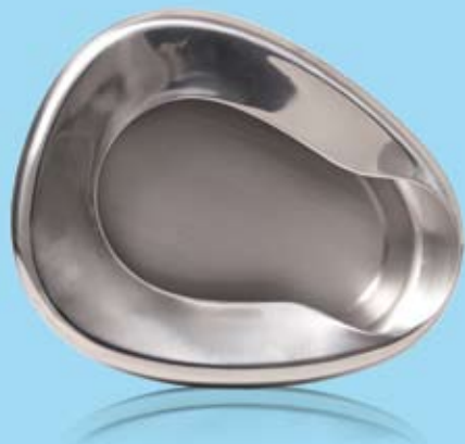
PLACENTABÄCKEN UTAN HANDTAG GYNAECOLOGICAL BEDPAN WITHOUT HANDLE