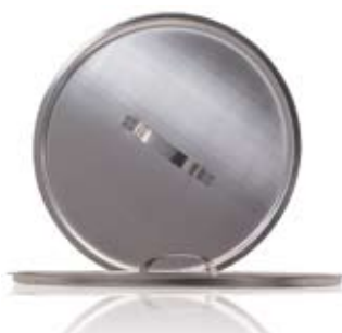
LOCK TILL HINK LID FOR BUCKET

523101 Ø 300 x 260 mm 10 L 523102 Ø 310 x 290 mm 12 L 523103 Ø 325 x 330 mm 15 L