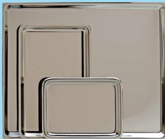
INSTRUMENTBRICKA INSTRUMENT TRAY

537000 180 x 120 x 10 mm 537004 385 x 210 x 10 mm 537007 445 x 350 x 10 mm 537001 215 x 160 x 18 mm 537005 400 x 270 x 15 mm 537008 445 x 350 x 25 mm 537002 300 x 200 x 15 mm 537006 490 x 320 x 19 mm 537107 440 x 325 x 10 mm 537003 360 x 240 x 15 mm