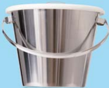
KLOSETTHINK UTAN UNDERDEL COMMODE PAN WITHOUT STAND