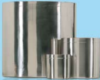
VADDBURK UTAN LOCK DRESSING JAR WITHOUT LID