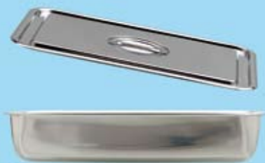
INSTRUMENTLÅDA MED LOCK INSTRUMENT CASE WITH LID

537000 180 x 120 x 10 mm 537004 385 x 210 x 10 mm 537007 445 x 350 x 10 mm 537001 215 x 160 x 18 mm 537005 400 x 270 x 15 mm 537008 445 x 350 x 25 mm 537002 300 x 200 x 15 mm 537006 490 x 320 x 19 mm 537107 440 x 325 x 10 mm 537003 360 x 240 x 15 mm