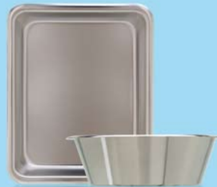
SVÄNGSKÅL INSTRUMENT TRAY/BOWL

539001 Ø 150 x 80 mm 1 L 539002 Ø 175 x 90 mm 1,5 L 539003 Ø 190 x 100 mm 2 L