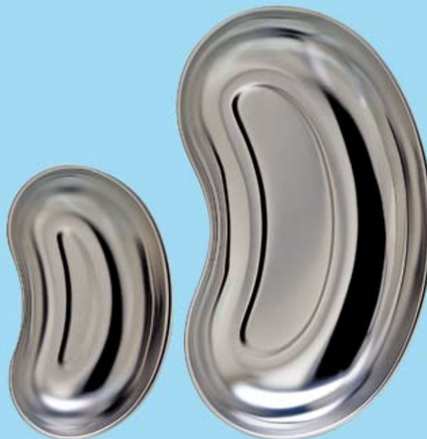
RONDSKÅL KIDNEY BASIN

534001 Ø 30 x 90 mm 534006 Ø 50 x 200 mm 534002 Ø 50 x 100 mm 534008 Ø 80 x 130 mm 534003 Ø 50 x 120 mm 534009 Ø 80 x 175 mm 534005 Ø 50 x 180 mm 534010 Ø 100 x 200 mm