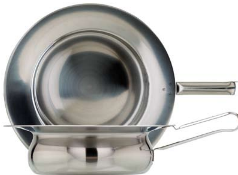
BÄCKEN MED BANDHANDTAG BEDPAN WITH BAND HANDLE

531001 Ø 235 x 70 mm 531002 Ø 310 x 80 mm