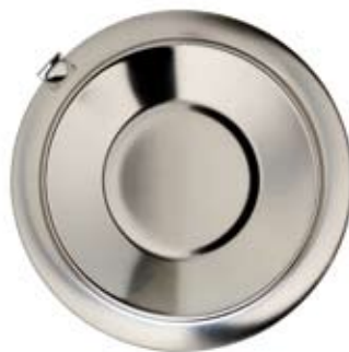
KROKLOCK LID WITH HOOK