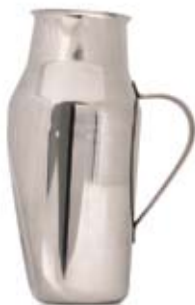
URINKANNA, KVINNLIG FEMALE URINAL