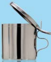
SPOTTKOPP MED GÅNGJÄRNSLOCK SPUTUM MUG WITH LID ON HINGE