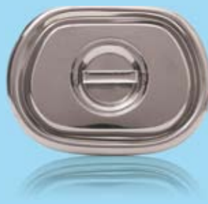
LOCK TILL 359904 LID FOR 359904