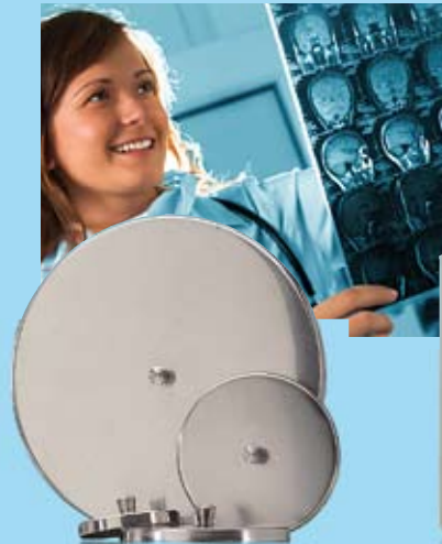
KNOPPLOCK KNOB LID