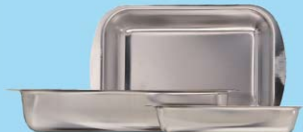
FÖRBANDSBRICKA DRESSING TRAY

517001 210 x 155 x 40 mm 517003 300 x 200 x 45 mm 517006 360 x 260 x 50 mm 517002 240 x 160 x 45 mm 517004 340 x 210 x 60 mm