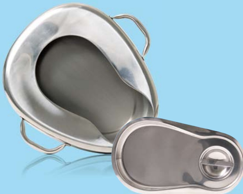
PLACENTABÄCKEN MED HANDTAG GYNAECOLOGICAL BEDPAN WITH HANDLES