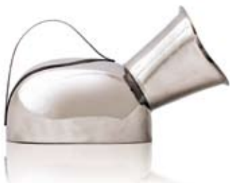
URINKANNA, MANLIG MALE URINAL