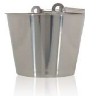
HINK UTAN BOTTENBAND BUCKET WITHOUT BOTTOM BAND

523007 Ø 255 x 245 mm 7 L 523000 Ø 285 x 205 mm 8 L 523001 Ø 300 x 245 mm 10 L 523002 Ø 310 x 270 mm 12 L 523003 Ø 325 x 315 mm 15 L